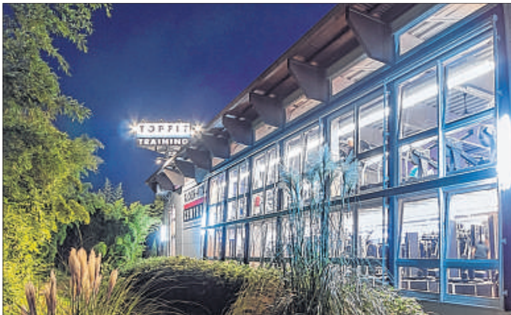
Die Kurs- und Trainingsräume sowie der Außen- und Saunabereich von Topfit in Weyhe bieten eine gepflegte Wohlfühlatmosphäre.