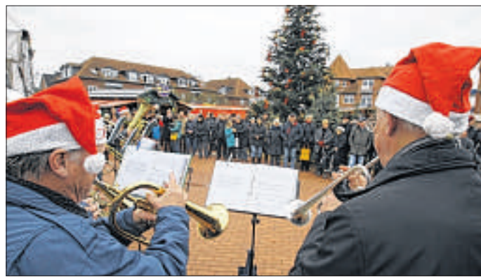
Ab Ende November verwandelt sich der Marktplatz anlässlich des „Weihnachtsmarktes“ in ein gemütliches Budendorf.

Zwischen Ständen bummeln, beim verkaufsoffenen Sonntag und Schnäppchen ergattern – das bietet der „Leester Herbstmarkt“, der im kommenden Jahr am 4. September stattfindet. xfl