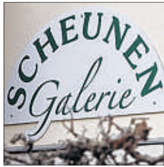
In der Scheunen-Galerie wird schon der Advent geplant.

Bei ihr finden die Kunden allerdings nicht nur Pflanzen, sondern auch frische Schnittblumen und dekorative Ideen sowie Accessoires für drinnen und draußen. Wer es beispielsweise im Außenbereich etwas schräg