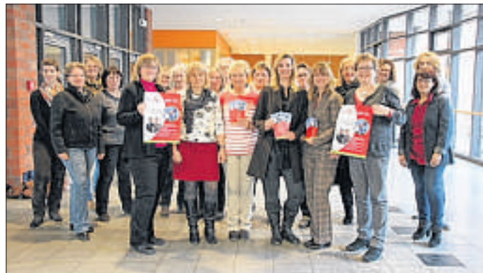
Die Unternehmerinnen des Netzwerks FairNet laden 2016 wieder zu einem spannenden Vortrag am Aschermittwoch ein.