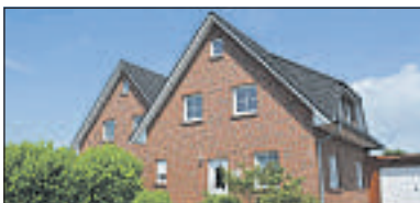
Bassum: Wovon Familien träumen! Bj. 2003, Wfl. ca. 117 m 2 , Grdst. ca. 390 m 2 , 4 Zi., 3 Schlafzi., Terrasse ca. 30 m 2 , Carport, Verbrauchsausweis: Energieverbrauchskennwert kWh/(m 2 *a): 149, Gas KP: 180.000,-