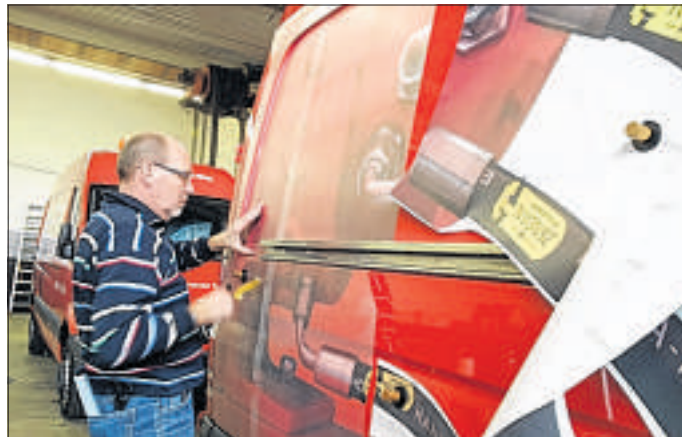
Die Beschriftung von Firmenfahrzeugen gehört zu den Schwerpunkten von Werbetechniker Otto Puch.

Nach Kundenwünschen produzieren die Werbetechniker außerdem Leuchtwerbung, Einzelbuchstaben, Aufkleber, Pylone, Roll-up-Displays, Banner, Visitenkarten, Firmendrucksa- chen und vieles mehr. „Ein Schwerpunkt liegt auf der Fahrzeugbeschriftung. Die angewendete Digitaldrucktechnik