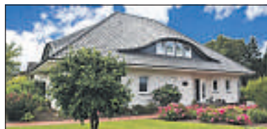
Bassum: Walmdachbungalow mit Fischteich im Grünen! Bj. 1995, Wfl. ca. 310 m 2 , Grdst. ca. 2.365 m 2 , 8 Zi., Kamin, Sauna, Doppelgarage, Energieklasse B, Verbrauchsausweis: Energieverbrauchskennwert kWh/(m 2 *a): 56,0, Gas KP: 399.000,-