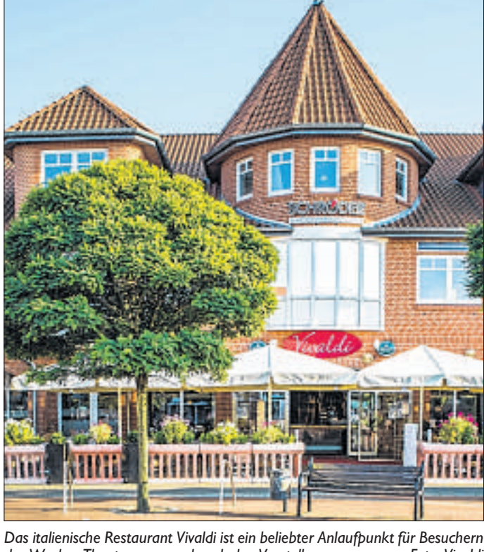
Das italienische Restaurant Vivaldi ist ein beliebter Anlaufpunkt für Besuchern des Weyher Theater – vor und nach den Vorstellungen.

Beim Blick in die Speisekarte erwartet die Gäste eine Auswahl an original italienischen Gerichten. Von Antipasti über Pizza und Pasta bis hin zu Fleisch und Fisch sind dort krea-