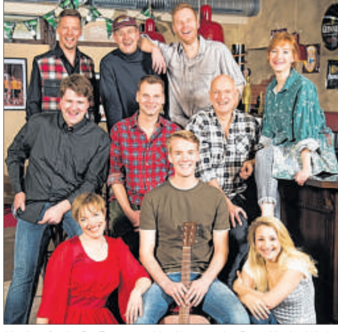
Mit dem Stück „Ein Traum von Irland“ startet das Ensemble des Weyher Theaters in die neue Spielzeit.

Neben einer äußerst unterhaltsamen, menschlichen und liebenswerten Story können