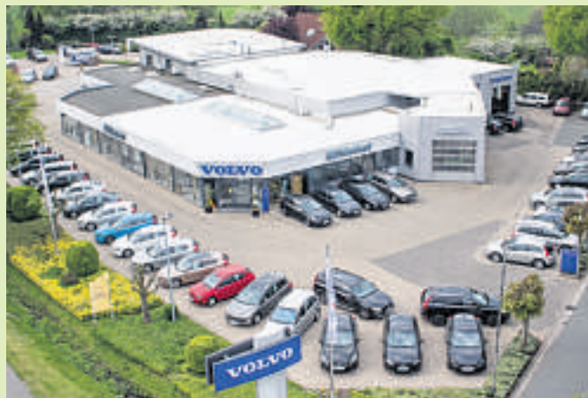
Das Autohaus Mühlenhort ist an fünf Standorten in ganz Norddeutschland vertreten. Die Erfolgsgeschichte des Unternehmens begann in Weyhe.