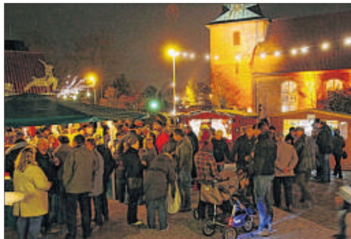
Traditionell lädt die Leester Werbegemeinschaft am ersten Adventswochenende zum Weihnachtsmarkt an der Marienkirche ein.