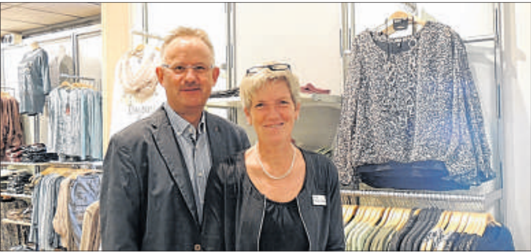
Das Modehaus von Hollen von Carsten Hauch und Ines Hencke-Hauch bietet auf 1000 Quadratmetern unter anderem sportive und klassische Mode für Frauen und Männer sowie Heimtextilien und Bettwaren.