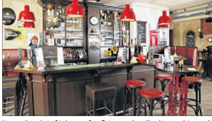
Livemusik und ein frisch gezapftes Guinness – diese Kombination können die Besucher von Shakespeare's Pub erleben.

Das gilt genauso wie die auftretenden Künstler und die für Norddeutschland doch eher ausgefallenen Biersorten. Direkt aus dem Fass werden beispielsweise Guinness, Kilkenny und Strongbow Cider gezapft. Außerdem gibt es Flaschenbiere, viele besondere Whiskey-Sorten, einige Weine und alkoholfreie Getränke. Und wie es sich für einen Pub nach britischem Vorbild gehört, hängt an der Wand hinter dem Tresen eine Glocke, mit der nachts die