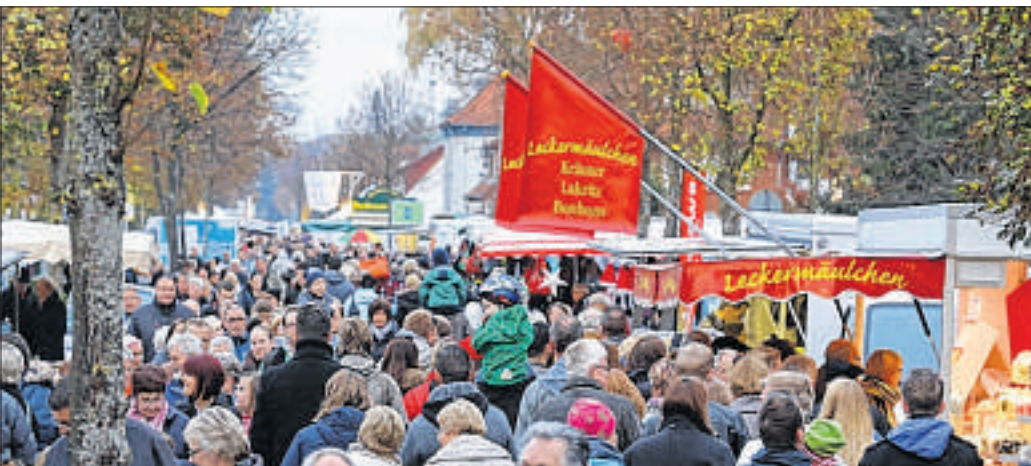
Zum Weyher Herbstmarkt Anfang November veranstalten die Einzelhändler einen verkaufsoffenen Sonntag. Ein buntes Rahmenprogramm mit Losaktion und Karussell soll zahlreiche Besucher anlocken.