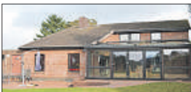
Weyhe: Ruhig mit Blick ins Grüne. Bj. 1989, Wfl. ca. 200 m 2 , Grdst. ca. 850 m 2 , Nutzfl. ca. 80 m 2 , 5 Zi., 2 Bäder, Wintergarten, 4 Stellpl., 1 Garagenpl., Verbrauchsausweis: Energieverbrauchskennwert kWh/(m 2 *a): 35,1, Öl KP: 298.000,-