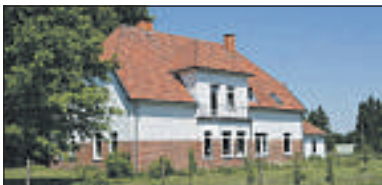
Syke – Wachendorf: Viel Licht, viel Platz, viel Lebensqualität. Bj. 1920, Wfl. ca. 370 m 2 , Grdst. ca. 6148 m 2 , 12 Zi., 2 Bäder, 2 Küchen, Gashzg., Bedarfsausweis: Endenergiebedarf kWh/(m 2 *a): 275,6, Gas KP: 495.000,-

Das große Gewinnspiel in „Das find' ich in Weyhe“ Seite 8