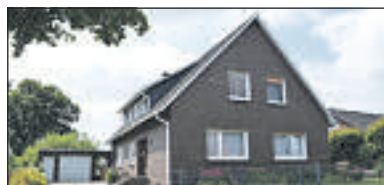
Twistringen: Viel Platz für die Familie! Bj. 1974, Wfl.: ca. 210 m 2 , Grdst.: 1089 m 2 , 8 Zi., 2 Bäder, 2 Küchen, Öllhgz., schönes Gartenhäuschen, Energieausweis ist in Bearbeitung KP: 165.000,-