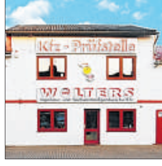
Auch Umweltplaketten werden in der Einrichtung verliehen.

Mittlerweile können nicht mehr nur Pkw und Motorräder, sondern auch Lastwagen, Wohnmobile und -wagen, Anhänger, Quads, Trikes und Trecker ge-