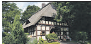
Harpstedt: Hier macht das Wohnen Spaß. Bj. 1975, Wfl. ca. 167 m 2 , Grdst. ca. 3.974 m 2 , 4. Zi., Ölbrennwerttherme aus 2008, Kamin, Doppelcarport, Nebengebäude, Schwimmteich, Energieausweis ist in Bearbeitung. KP: 370.000,-