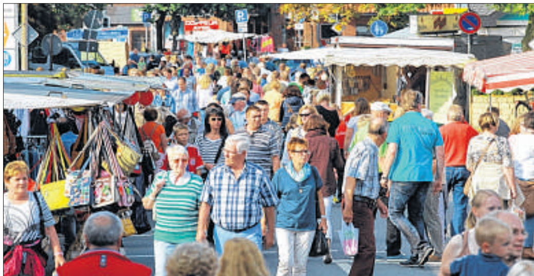
Am 6. September verwandelt sich die Leester Straße erneut in eine Flaniermeile. Anlässlich des Herbstmarktes mit verkaufsoffenem Sonntag locken die Geschäfte mit vielen Attraktionen und Angeboten.

„Leester Herbstfest“ und „Weyhe total“ sind geplant